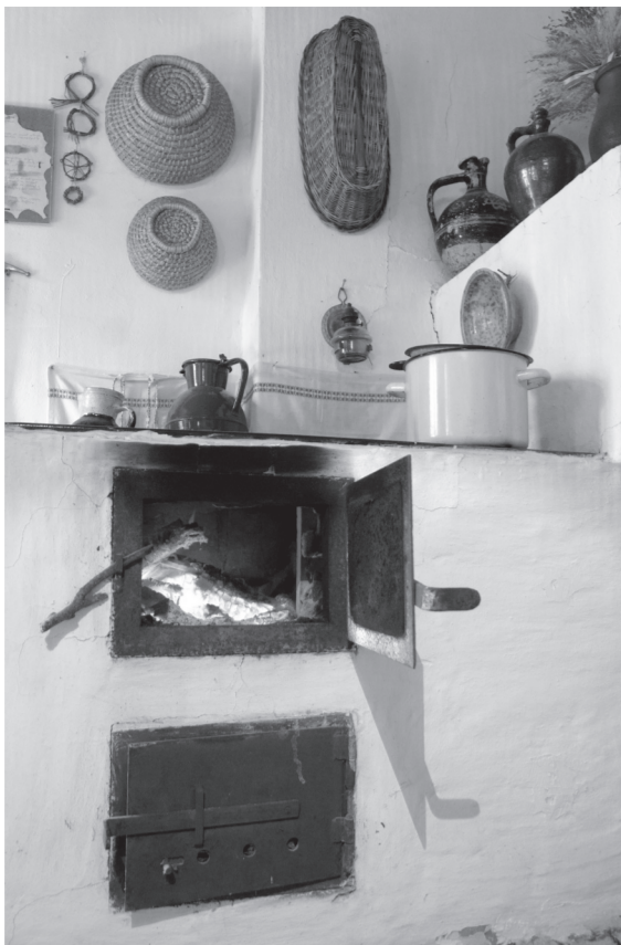
Fotó: Mária Zsófia

Nyitom a rácsot: álarcként tapad arcokra a hő, s a fény elvakít: peng a parázs: tűnt nyarak húrjait zendíti tán a búcsúzó anyag: vágytalan gyönyör minden pillanat, amije van még, tündérmuzsika és ragyogás. Az arany zuzmara borzong itt-ott, hűl és zsugorodik, a máglyára csipke hamuhodik, de tüze még nagy, mint egy alkonyat, s valamit súg. Mit? Attól függ, ki vagy.