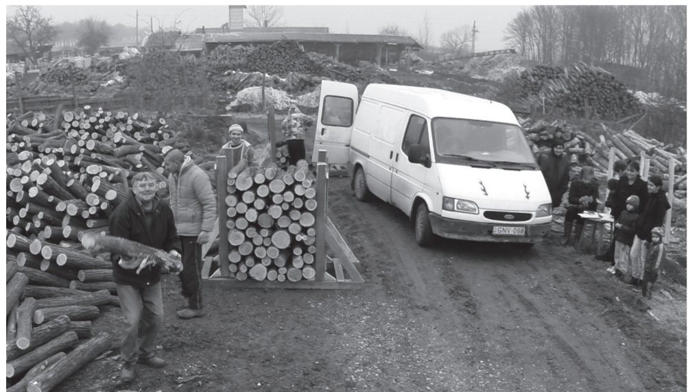
Rakodás a szátoki fatelepen