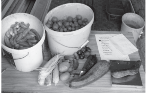
Egyszerű árusítóhely a kertészet mellett