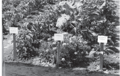
Növényegyüttesek a tangazdaságban

A polgármester-asszony azt mondja, vannak problémák a közmunkaprogrammal, de itt, Erdőkürtön látványos a változás, amióta rendszeres foglalkoztatást tudnak nyújtani ilyen keretek között azoknak, akik nem találnak munkát. Megújult a falu képe: gondozott lett, parkosítottak, a temetőt is sikerült visszafoglalni a szarvasoktól – bekerítették, s rendszeresen gondozni tudják. A valódi, értelmes tevékenység visszaadja az emberek önbecsülését. A tartós munkanélküliség, a kilátástalanság, a teljes elszegényedés demoralizál. A polgármester-asszony rendszerben gondolkodik. Az önkormányzati kertészet mellett mindjárt kis elárúsító helyet is kialakítottak, ahol helyben meg lehet vásárolni a friss zöldségeket, gyümölcsöket, s a fejében már megvan a kisállat tartó udvar terve is: néhány ma-