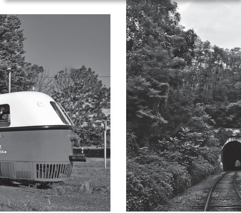
Az 1896-ban épült Becskei alagút