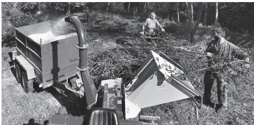
Dóbiásik Gábor „bozótmaster” táplálja az ágdarálót