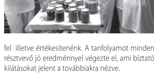
fel illetve értékesítenénk. A tanfolyamot minden résztvevő jó eredménnyel végezte el, ami biztató kilátásokat jelent a továbbiakra nézve.

A hosszabb távú közmunkaprogramban zöldség és gyümölcsfeldolgozó tanfolyamot indítottunk a Rétság-i munkautyú központ támogatásával. A START mintaprogramban a mezőgazdaságon belül a későbbiekben szeretnénk kibővíteni tevékenységünket. A megtermelt zöldségeket és gyümölcsöket további feldolgozás után használnánk