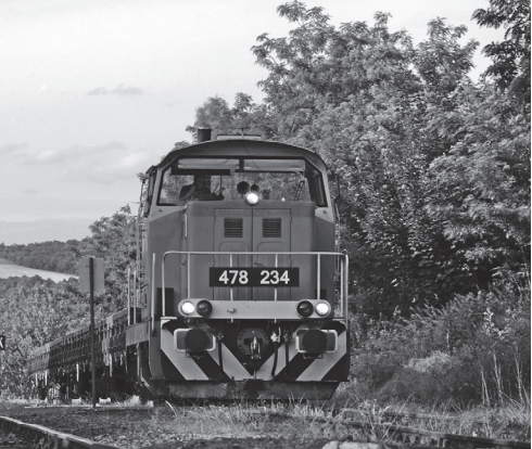
M47-REMOT – „Dácsia” (1975) Magyarnándornál