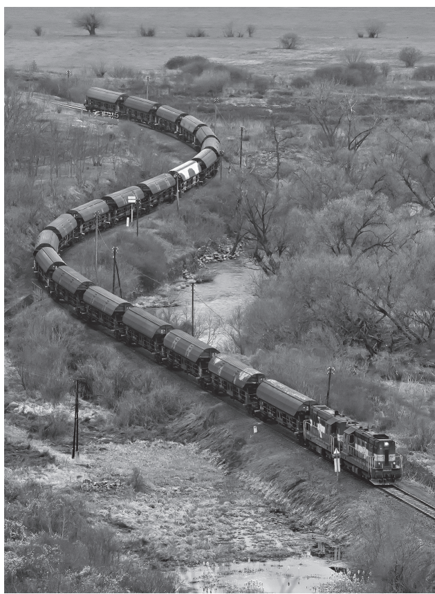
ZSSK 742-es – „Kocur” (1977) Nógrádszakálánál

Régóta tudom, hogy van egy különleges emberfajta, akit vasútrajongónak hívnak. Vonzalma a vasút iránt valamilyen más érdeklődéssel is párosul: van, aki fotózik, van, aki a vasúttörténelmet tanulmányozza, mások elhagyott vasúti létesítményeket térképeznek fel, sokan vesznek részt vasúttörténeti relikviák mentésében. És akkor a modellezőkről még nem is beszélünk! A vasútrajongóknak világszerte egyesületeik, klubjaik, újságjaik vannak, s természetes, hogy amióta léteznek, a világháló a legfontosabb – virtuális – találkozóhelyük.