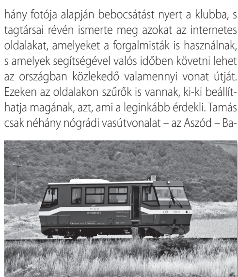
FGV – Felügyeleti Vágánygépkocsi (2007)