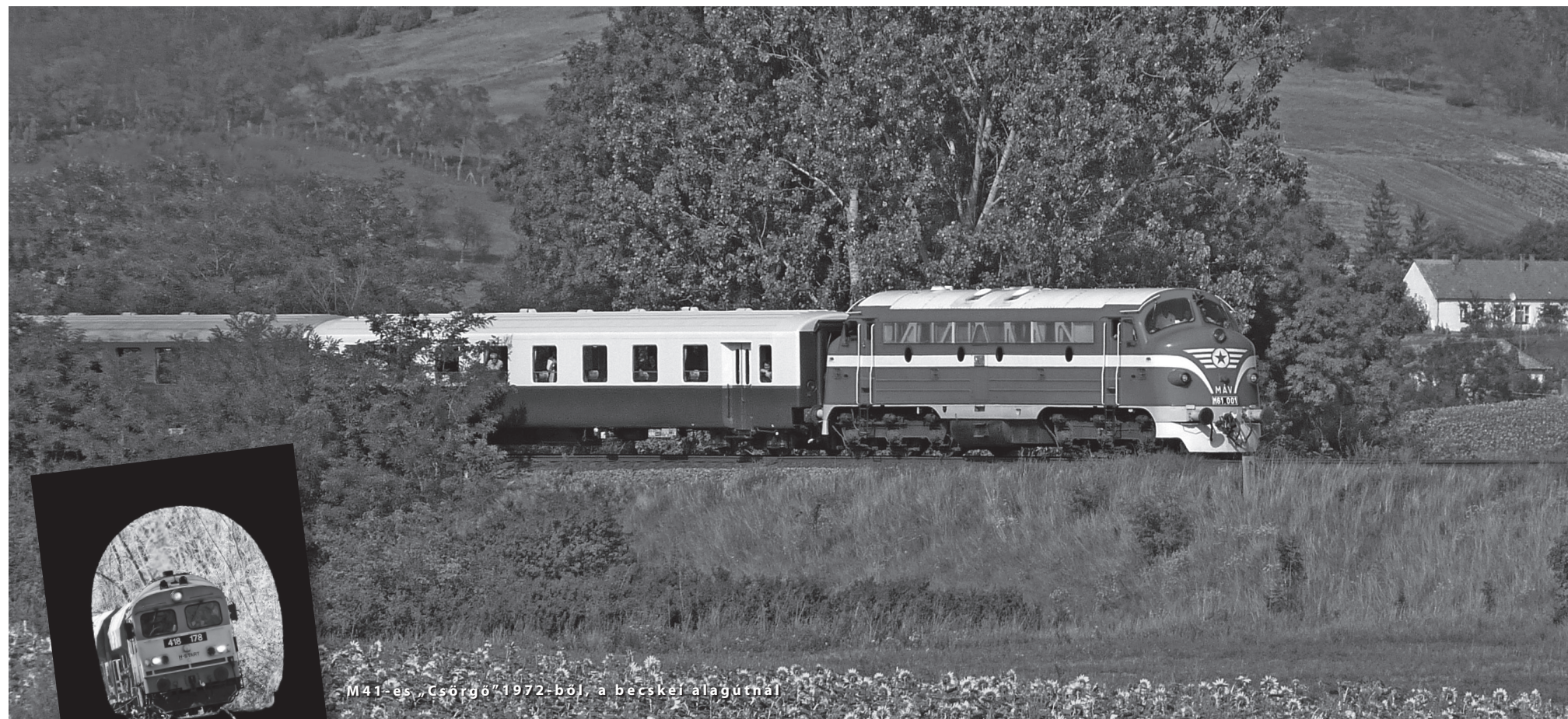
M41-es, Csörgő, 1972-ből, a bécsi alagútnál

Kétdobony, Kiscset, Szátok, Sente és a környékbeli falu- közösségek lapja