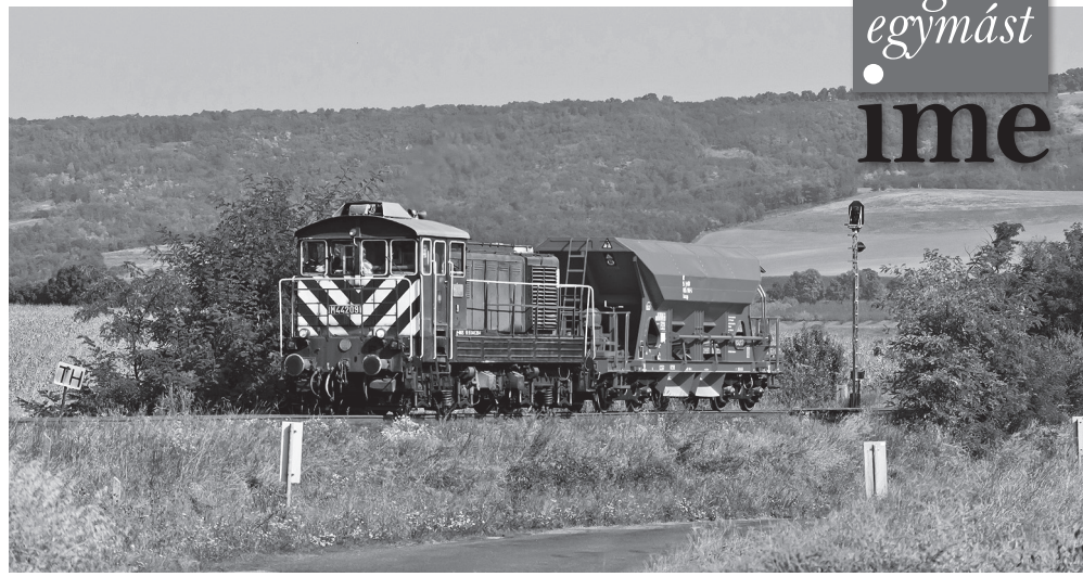
M44-es – „Bobo” (1954) Magyarnándornál