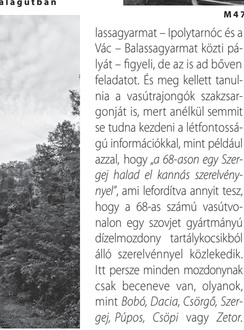
M47-REMOT – „Dácsia” (1975) Magyarnándornál