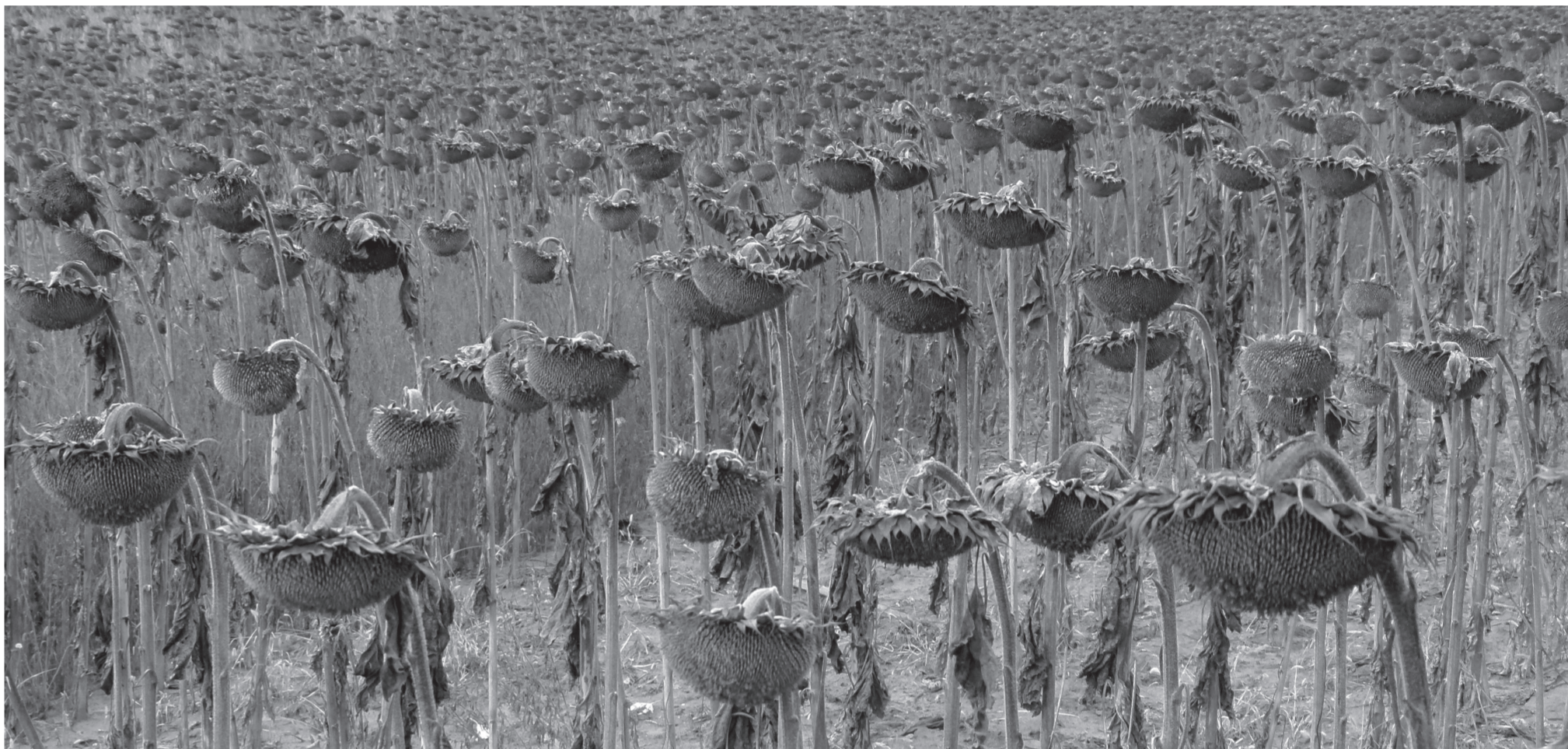
Beérett a termés – 2017. (2.)

Kéthodony, Kiscset, Szátok, Sente és a környékbeli faluközösségek lapja