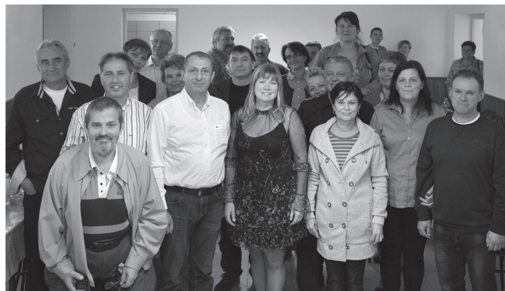
Fotók: Szabó Izabella

Falutörténeti monográfiái mellett több mint hatvan tanulmányában, cikkében tárta fel és írta meg régi prédikátorok, iskolamesterek, kuruc tábori papok, hajómalom-molnárok, szürszabók, tisztartók és egyszerű parasztszadálók történetét. De tőle tudjuk azt is, hogy Kosdon valaha kőszénbánya működött, hogy az utolsó cserhádi betyárt Sisa Pistának hívták, és hogy Vácot van család, amelyik 450 éves helyi multtal dicsekedhet. Azaz, 1946 óta művelte azt, amit ma a történettudomány mikrohistóriának nevez, és amiben az ideológiákból és a nagypolitikából kiábrándult XXI. századelő még hinni tud. Első tanulmányát 20 éves korában írta. Utolsó munkája nyomdában volt elhunytakor, poszthumusz műkét kerül egy hosszú lista végére.