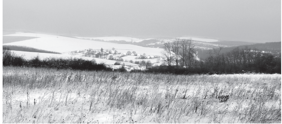
Látszólagos tél (Debercsény-újtelep, 2018. január)

Ki nem találkozott még a herpesz vírusával? Az emberek nagy százaléka hordozza magában ezt a kórokozót, sokan úgy, hogy szemmel láthatóan nem is találkoznak vele. A herpesz vírusának sok fajtája létezik, okozhat kiütést ajakon, nyálkahártyán, nemi szerveken, vagy a bőrön. Maga a vírus gyakorlatilag mindenhol megtalálható: közösen használt eszközökön, kilincseken, járműveken, a kapaszkodókon és sok más helyen is. Mikor alakul ki a tünet? A vírus akkor aktiválódik, ha a szervezet immunrendszere legyengül. Ez lehet lázas állapot, stressz, fizikai megterhelés, gyomorrontás, fogászati kezelés vagy éppen antibiotikumok szedése . Milyen típusú kiütést idéz elő? A herpesz leggyakrabban az ajakon okoz tünetet: kezdetben égő, viszkető érzés, majd fájdalmas hólyagok megjelenése következik. A gyógyulási szakaszban a hólyagok beszáradnak, varrasodnak, végül hegek nélkül gyógyul a kiütés. Gyógyítása: Már a kezdeti viszkető szakaszban kezelhetjük gyógyszeres krémmel, népi gyógyszerrel a mézzel vagy szeszes ökörfarkkóró szírmának nedvével való kengetéssel. Fertőtlenítő folyadékokkal való kezelés lerövidíti a gyógyulási szakaszt. A herpesznek egy másik típusa okozza a bárányhimlőt, ami leggyakrabban a kisgyermek betegsége. Ez lehet könnyebb lefolyású, megszámálható pöttyökkel, de súlyos, összefüggő, fájdalmas hólyagokkal is jelentkezhet.