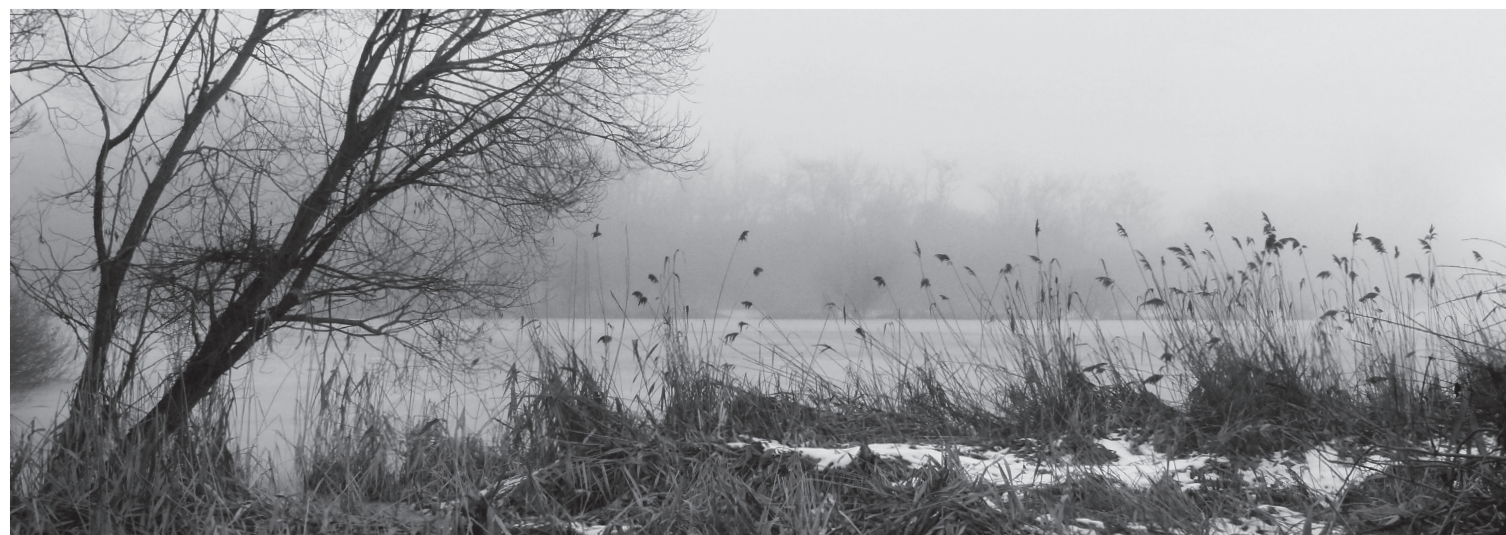
Tél a tavon (Kétbodonny, 2018. január)