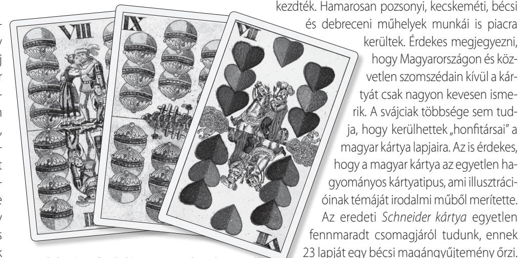
A cselekmény fordulópontjai a lapokon: Tell búcsúzik családjától • Gessler pőznára tűzött kalapja • Tell nyíla torkon találja a zsarnokot