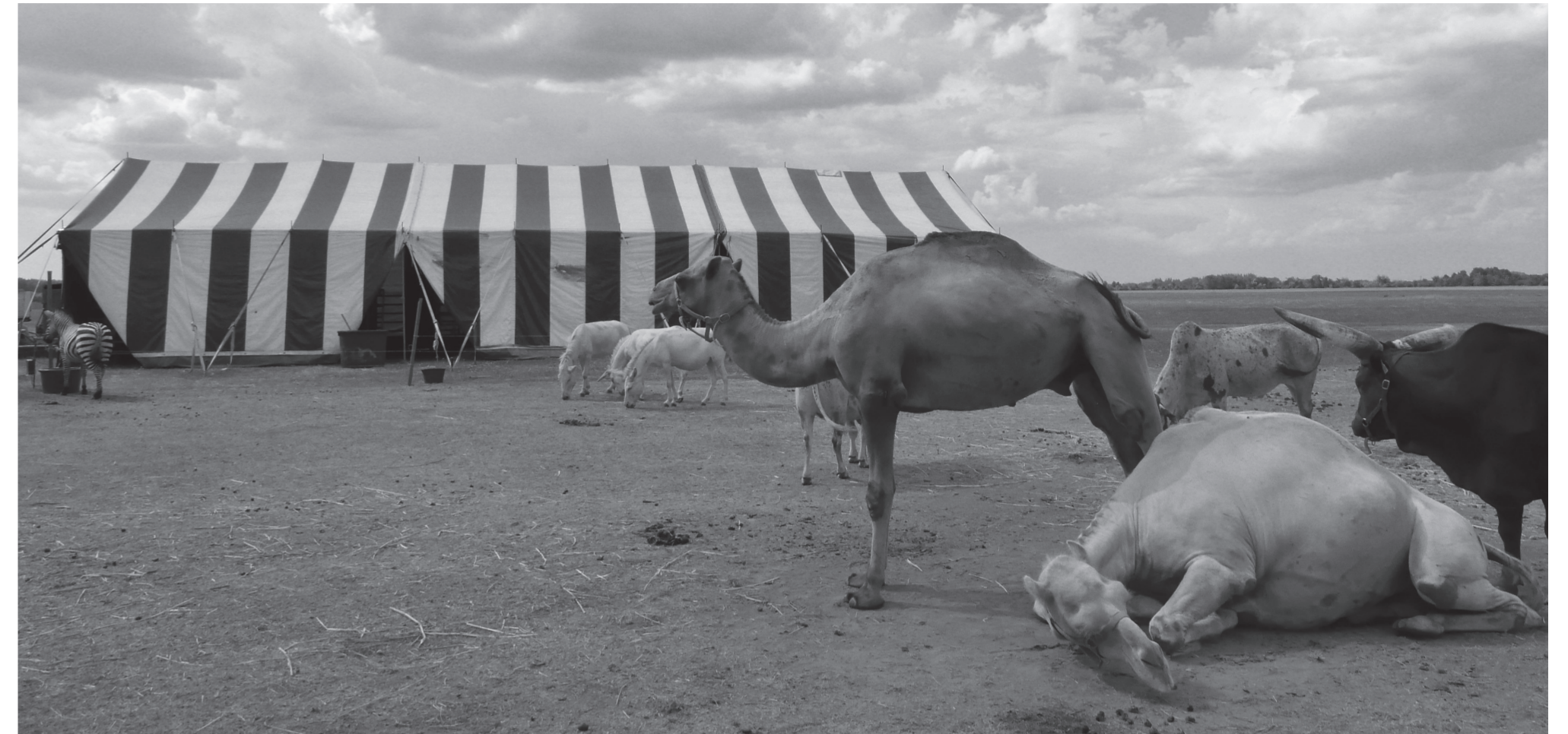
Vándorcirkusz az Alföldön – Hauer Lajos fotóművész kiállításából. (cikk a 3. oldalon)

Kétdobony, Kiscset, Szátok, Sente és a környékbeli faluközösségek lapja