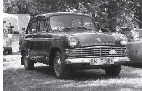
A Moszkvics 407-es...