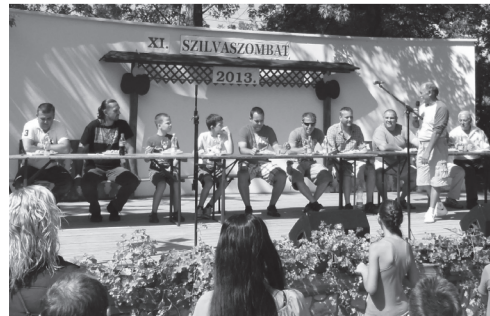
A gombócevő verseny résztvevői a start előtt