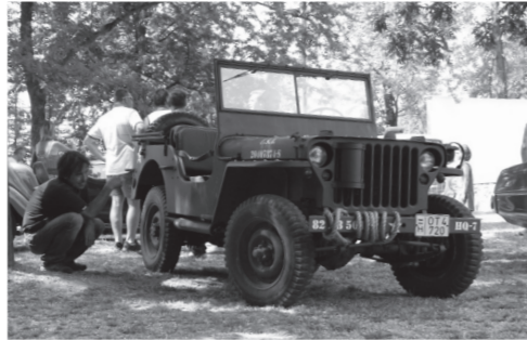
A híres amerikai Willys Jeep...