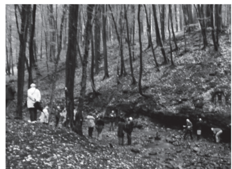
Az érkezők italoznak a forrásnál