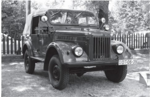
...és a szovjet Gaz 69-es parancsnoki terepjáró