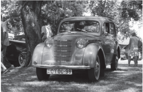
...és elődje, a Moszkvics 401-es