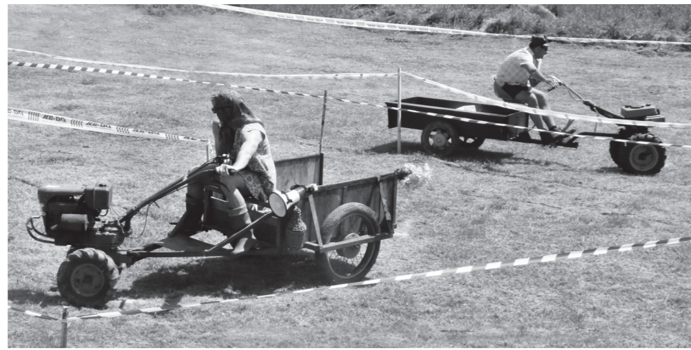
Ki még kanyar előtt, ki még kanyar után – párhuzamos pályák