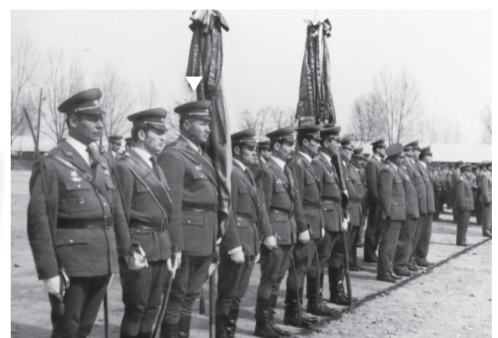
Ünnepi szemlén Aszódon, 1970-ben