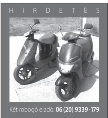
Két robogó eladó: 06 (20) 9339-179