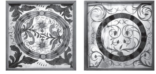
Fa mennyezetkaszetták a szentei templomból (további öt megmaradt darab a templomban ma is látható)