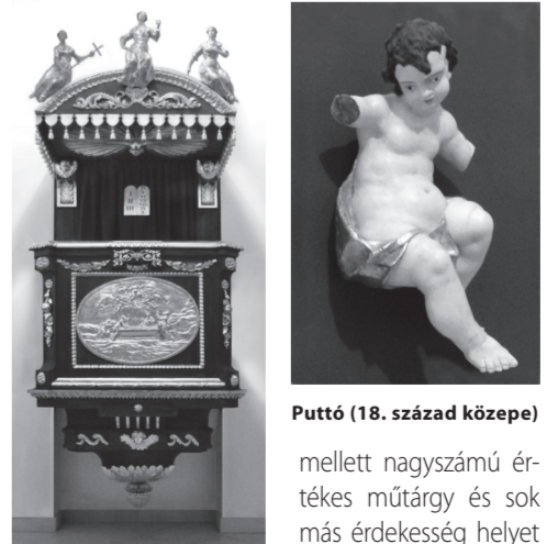
Későbarokk, már klasszicizáló szöszeék 1804-ből

ugyanakkor közvetlen hangú, néha a humort sem nélkülözö előadások végig lekötötték a hallgatóság figyelmét, a jelenlévő váci Serenus Kórus színvonalas fellépése pedig még színesebbé, élményszerűvé tette a délutánt. A Nagyrépost Palota , melynek falai már önmagukban is igazi különlegességgel szolgálnak és a gyűjtemény, melyben a kiscseti püspökszobrok