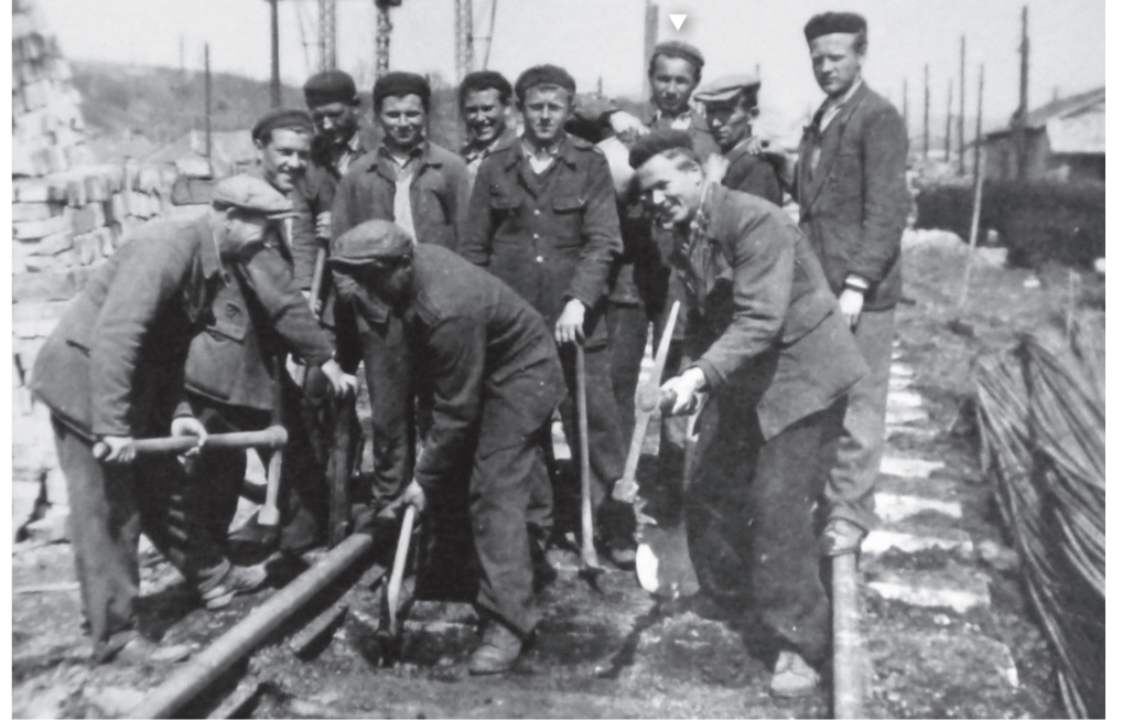
A kiscseti brigád 1957-ben, a Pálfalvai Síkúveggyár iparvágányának építésén