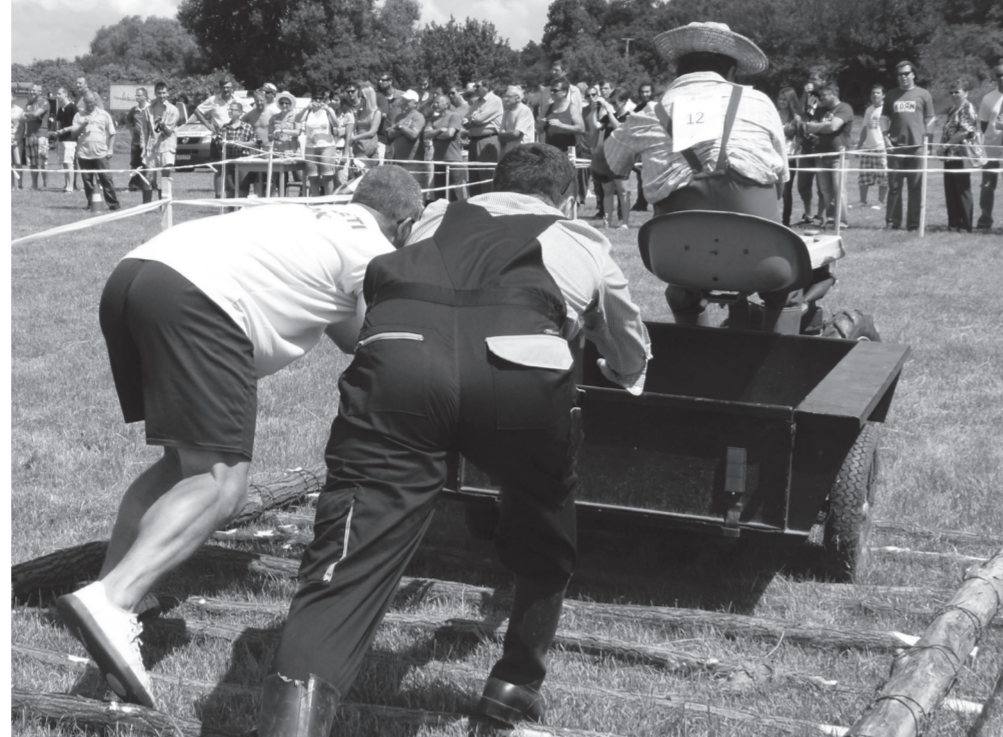
Elkél a segítség a "dagonyán" és a "rázaton"