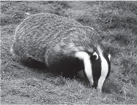
Borz táplálékot keres