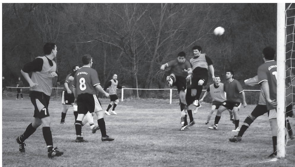
Légiharc a kapu előtt