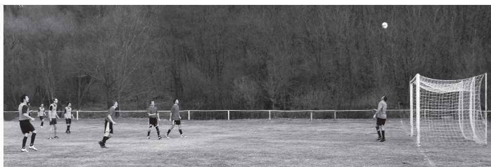
Ilyen is volt – a levegő ura