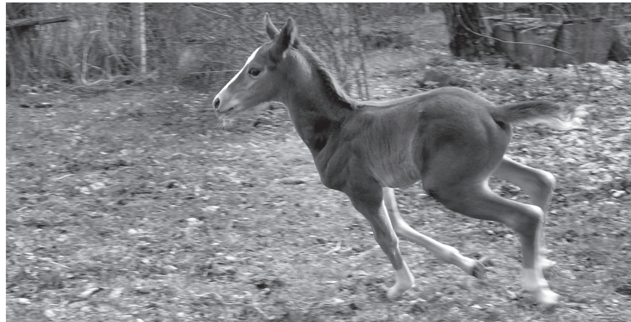
Tavaszi lendület (Született: március 15-én.)