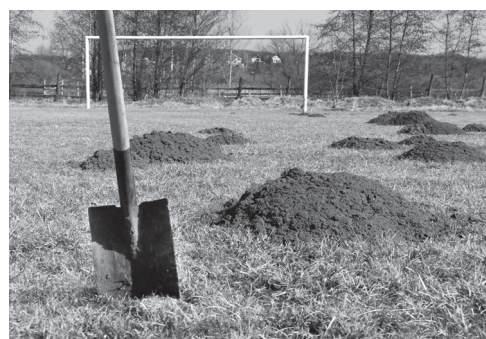
Nulladik mérkőzés: Hazaiak – hazaiak ellen