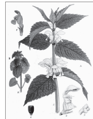
A fehér árvaszalán levelei szív alakúak és nincsenek a növényen mirigyszőrök

A fehér árvaszalán csak hasonlít a csalánhoz, de egyébként egészen más problémákra használhatjuk. Onnan lehet egyértelműen megkülönböztetni, hogy levelei szív alakúak, hegyesebbek és nincsenek a növényen mirigyszőrök, s ezért nem is okoz égető érzést. Gyógyításra ennek a növénynek a virágját használják. A tudományos vizsgálatok szerint légúti megbetegedések, valamint a száj és a torok nyálkahártyájának gyulladása, elváltozása, és enyhe bőrgyulladások esetén számíthatunk jótékony hatására. A növényben lévő szaponinok határozottan elősegítik a lerakódott hurut felszakadását.