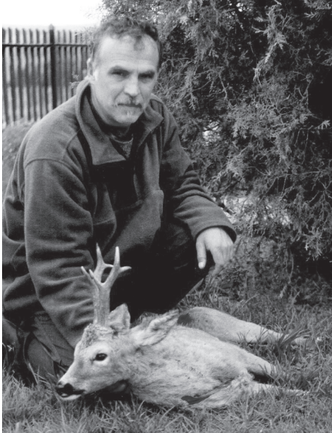
Egy szép őzbak

– Kezdjük a beszélgetést személyes kérdéssel! Téged ki vitt be az erdőbe? – Mondhatjuk, hogy én önként mentem, de az első lépésekre azért várnom kellett egy ideig. Gyermekkorom óta erdész szerettem volna lenni, aztán mégis műszaki pályára kerültem. Talán ezért lett bennem még erősebb a vágy a természet közelségére. 1985-ben, házasságkötésem után egy vadász szomszédságába költöztem, aki sokat mesélt nekem az erdei világról – mondhatjuk ő volt a „megrontóm”, de mint említettem, könnyű dolga volt. Először a somogyi erdőket ismertem meg, még az ő segítségével, aztán már önállóan, az ország sok más vidékén is vadásztam. Így jutottam el vendégvadászként 1998-ban a romhányi Rákóczi vadásztársasághoz, és akkor találtam rá Kisecsetre is. Mély benyomást