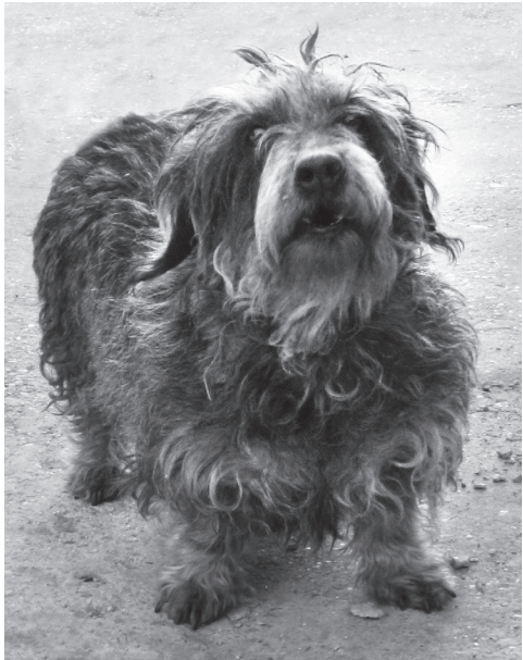
Melba, a tartalékos