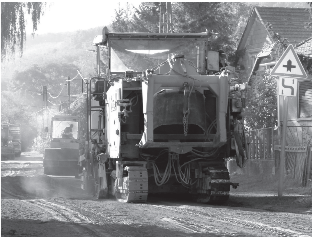
A marógép lassan hald a cementpor rétegen