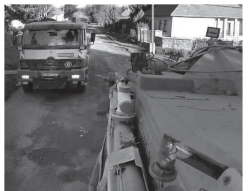
A parancsnoki hid alulról és felülről