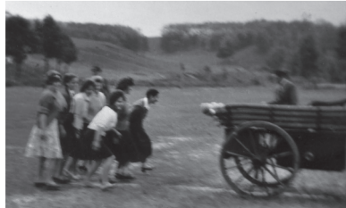
Startol a női egység