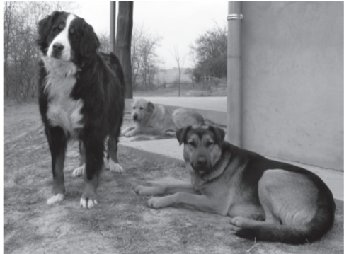
Együtt az őrség – Bodza, Tigi és Zorró