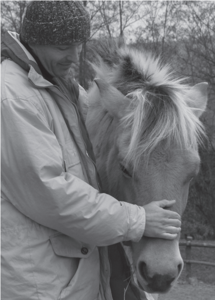
Nati, a két kedves norvég egyike, gazdájával