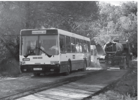
Bár még folyt a munka, az első autóbusz délután 4-kor, az új szakaszon már behajthatott Kiscesetre