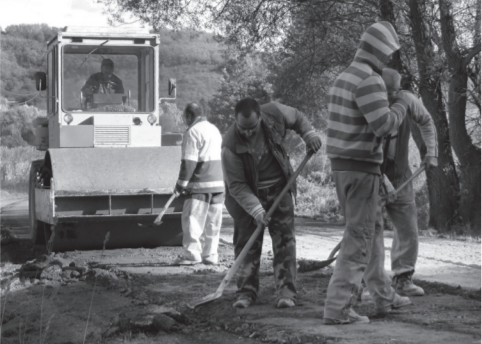
Tiszaörsi munkások egyengetik az új alapot az úthenger előtt