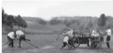
Versenyben a kisecseti férfi csapat