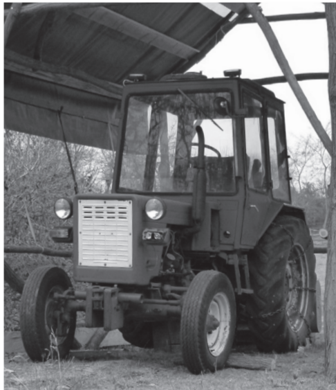
A T-25-ös minden feladatára várva