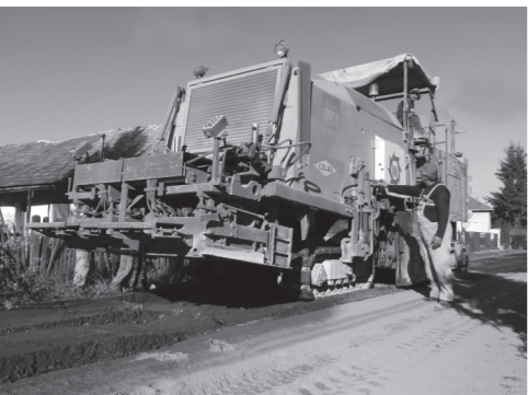
A munkahenger felemelése a frissen leterített rétegről

számító technológiával – főútnak felújítása: Első lépésként a kátyúkat kitöltve elsimítják az útfelületet, majd a már sík utat locsolókocsival végigöntöztik, és az így előkészített, már nedves felületre vastag cementpor réteget terítnek. Ennek vastagsága hozzávetőlegesen 15 cm. Ehhez négyzetméterenként körülbelül 20 kg cementpor szükséges. Amikor ez is megtörtént, akkor következnek csak a munka leglátványosabb, érdemi része, az út felmarása. Ezt a módszert már 15 éve alkalmazzák Németországban, nálunk csak néhány éve honosodott meg, de ma már több ilyen nagy marógép is működik az országban.