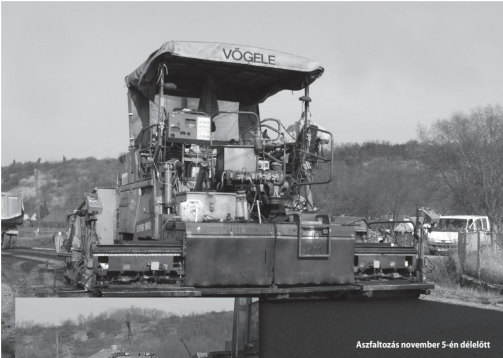
Aszfaltozás november 5-én délelőtt