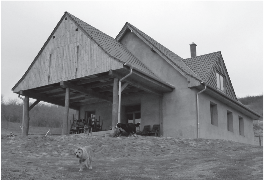
A csaknem kész ház és őrzi