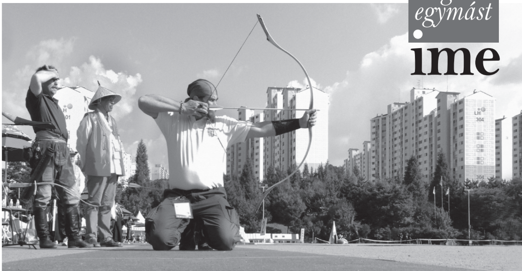
Lövés a közeli állatcélokra

Megtudjuk, hogy egy pontos lövés szerinte 30 300 éves szarujjat, amely még mindig tökéletesen működött. Ő a maga eszközeit kiváló szakemberektől szerzi be,