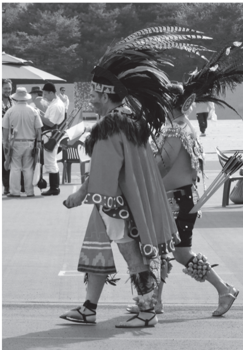
Mexikói versenyzők dél-amerikai indián öltözetben