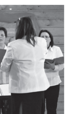
A Kétdobonyi Vegyeskar (fent) és a Romhányi Dallamkórus (lent)

A Kétdobonyban tartott ünnepi megemlékezéseknek azonban van egy sajátossága, ugyanis az országosan ünnepelt évforduló egybe esik egy helyi történelmi esemény