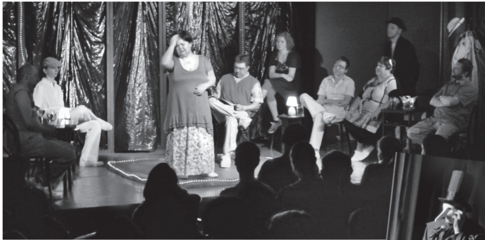
Az Észti Színház társulata (Órszójfalú, Szlovákia) a nyitó előadásán, Háy János: Házasságban innen és túl című darabjában. Jobbra: a Fesztivál Szelleme mobiltelefonál a megnyitón.

34. alkalommal adott otthont a nagy érdeklődésre számot tartó fesztiválnak. A város legrangosabb kulturális eseménye több, mint országos jelentőségű, hisz már régóta határainkon túlról is vonzza az érdeklődőket és a résztvevőket. Az ISZN 1964-ben, mint pódiumműsorok helyi seregszemléje indult, de hamarosan olyan sikeres lett, hogy néhány év alatt országos fesztivállá nőtte ki magát, 1983-tól pedig már a magyar nyelvű amatőr színját-