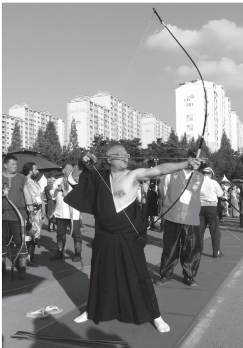
Japán íjász, hagyományos tradicionális yumi íjjal